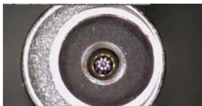
Dettaglio della stessa ottica dopo il trattamento BICAR med ®