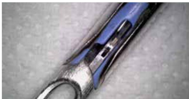
Dettaglio della stessa pinza dopo il trattamento BICAR med ®