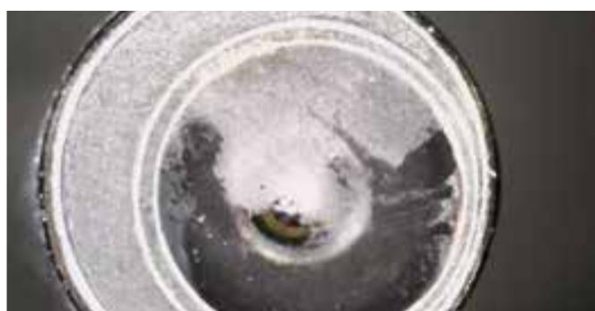
Dettaglio di un'ottica prima del trattamento BICAR med ®