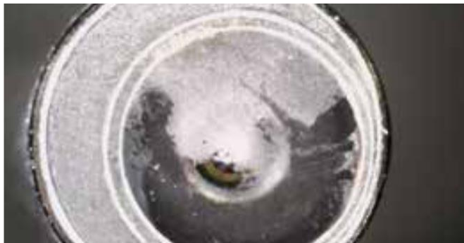
Detailaufnahme einer Optik vor der BICARmed®-Behandlung