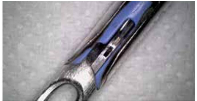
Detailaufnahme derselben Zange nach der BICARmed®-Behandlung