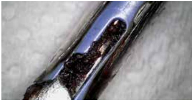
Detailaufnahme einer laparoskopischen Zange vor der BICARmed®-Behandlung