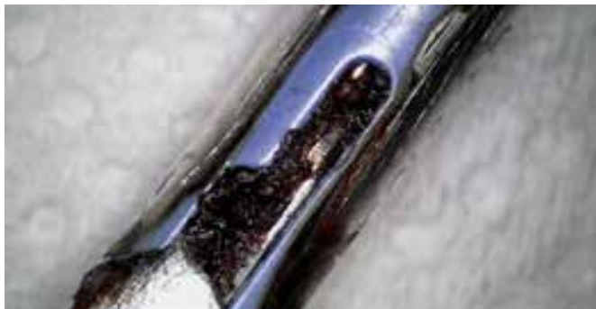
Detailansicht einer laparoskopischen Pinzette vor der BICARmed®-Behandlung