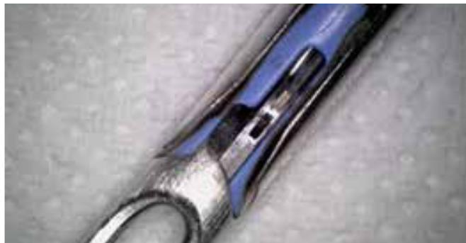
Detailansicht derselben Pinzette nach der BICARmed®-Behandlung